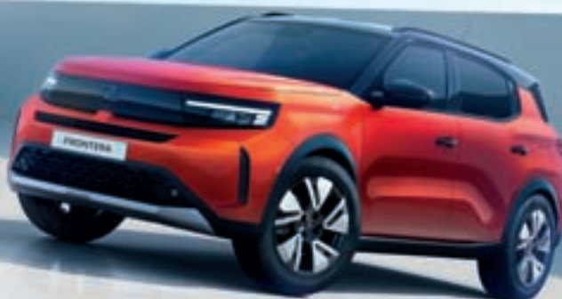
FRONTERA ŽE OD 15.590 €* Z VKLJUČENO SUBVENCIJO