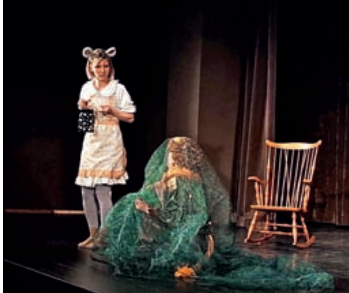
Miška je kljub svoji majhnosti pomagala levu.

S pomočjo režiserke so oblikovale tri različne basni in jih z dedkom Ezopom povezale v enotno zgodbo pravljic iz skrivnostne shrambice. »V zgodbah smo spremljali miško, ki je kljub svoji