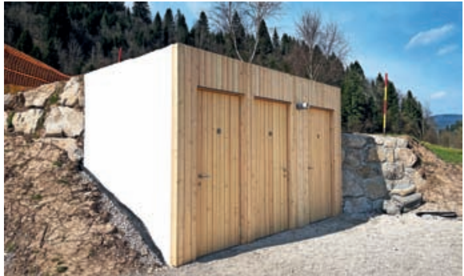
Nova sanitarna enota na Pustotniku

Dela v sklopu nadaljnje ureditve območja Pustotnika so se začela konec lanskega leta, nove pridobitve pa bodo uradno odprli konec maja. Naložba je po pogodbi vredna dobrih 150 tisoč evrov, od tega so 100 tisoč evrov pridobili iz Evropskega kmetijskega sklada za razvoj podeželja. Aktivnosti in rezultati projekta so namreč namenjeni spodbujanju razvoja podeželskega območja LAS loškega pogorja in prispevajo k boljši kakovosti življenja in bivanja na podeželju. »Z načrtnim urejanjem tako Pustotnik postaja prijeten skupnostni prostor za kakovostno in aktivno preživljanje prostega časa vseh generacij,« sta poudarili Jana Peternel in Olga Vončina.