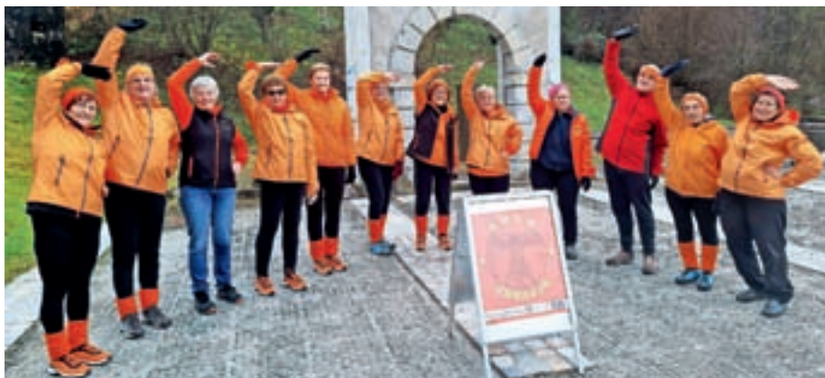
Člani skupine Žirk se zbirajo pred muzejem v Starih Žireh.

V zimskem času vadbo 1000 gibov začnemo ob 8. uri vsak dan med tednom, vadba traja pol ure, kmalu pa se dogovorimo za začetek ob 7.30. 1000 gibov izvajamo po metodi nevrologa in manualnega terapevta dr. Nikolaja Grišina, in sicer v lepem vremenu pred muzejem v Starih Žireh, v primeru slabega vremena pa nam streho nad glavo nudi balinarsko