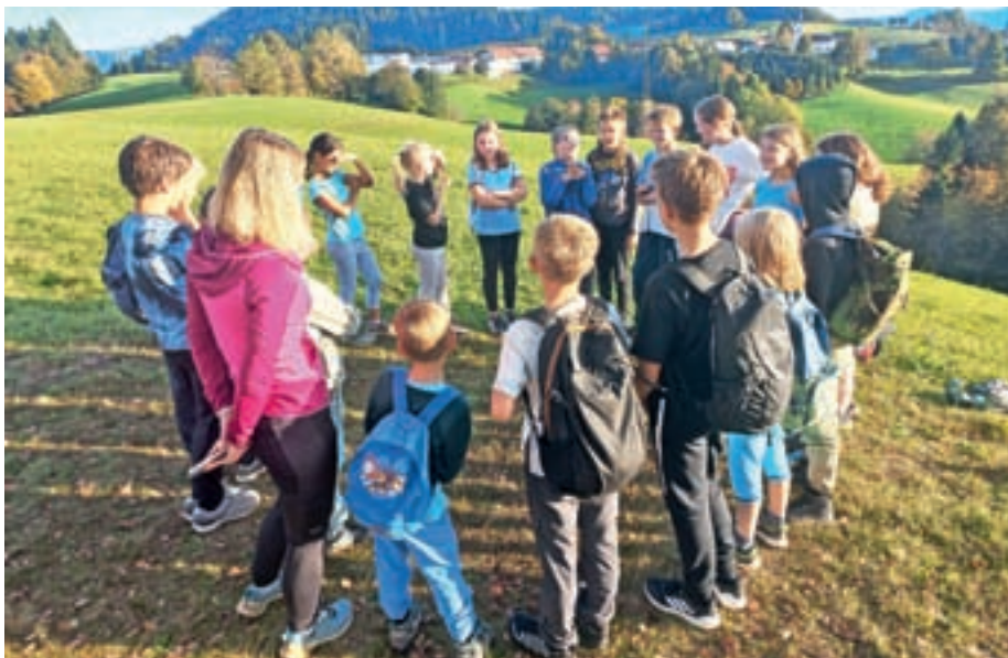
Učenci planinskega krožka na pohodu