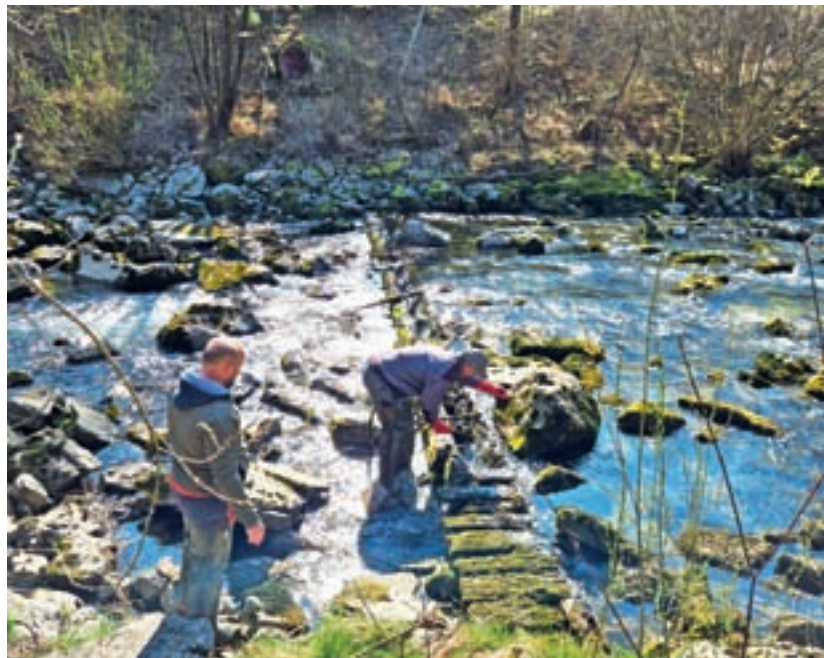
Čistilni akciji Očistimo Žiri se je letos pridružilo 127 prostovoljcev.