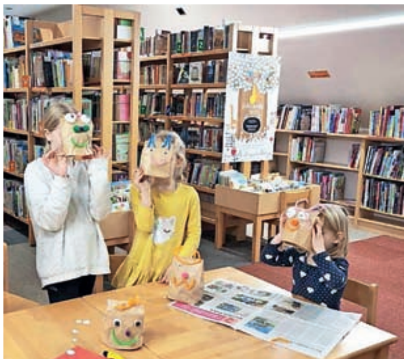
Februarska Pravljica ustvarjalnica