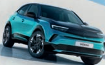
MOKKA ŽE OD 19.390 €*