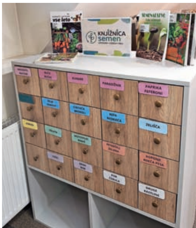
Knjižnica semen

Predstavitve domačinov imajo vedno svojevrsten učinek, poleg tega pa je namen knjižnice tudi povezovanje lokalne skupnosti. V pomladnih mesecih še vedno poteka program za otroke. Prav tako nadaljujemo cikel rokodelskih delavnic Pravljica ognjišče. Obe prireditvi potekata vsak mesec in sta za otroke brezplačni. Knjižnica Ivana Tavčarja že dvajset let v sodelovanju z Radiem Sora pripravlja oddajo Beremo skupaj. V njej knjižničarke vsak teden v branje priporočamo knjigo po svojem izboru. V znak jubileja smo v knjižnici pripravili zgibanko z bralnimi priporočili in poudarili nekaj knjig iz nabora. Vabljeni, da posežete po njih.