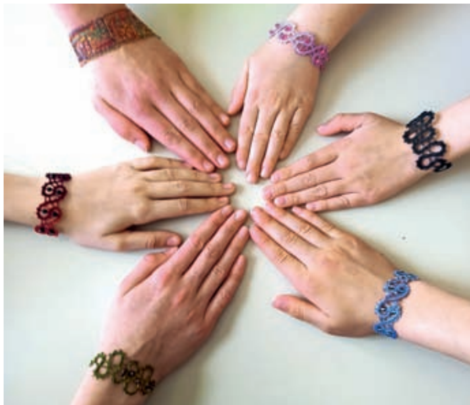
Klekljančki v obliki zapestnic na dekliških rokah klekljaric interesne dejavnosti Klekljanje v Osnovni šoli Polhov Gradec

pogosto pomagamo s sobesedilom. Izraz klekljanček pa označuje natančno tisto, kar iščemo. Zanesljivo nam povzame prav klekljano čipko. Je namreč enobeseden, ni iz dveh besed, kot na primer šivana čipka ali tračna čipka. Sam po sebi se razkriva kot izdelek majhnih razsežnosti, a takoj ga lahko povečamo tako, da mu odvzamemo del glasov in ostane samo klekljanec. Ta pa glede na velikost izraža precejšnjo razsežnost. Po vseh besedotvornih pravilih sta oba izraza, klekljanček in klekljanec, pravilno izpeljana iz trpnega deležnika