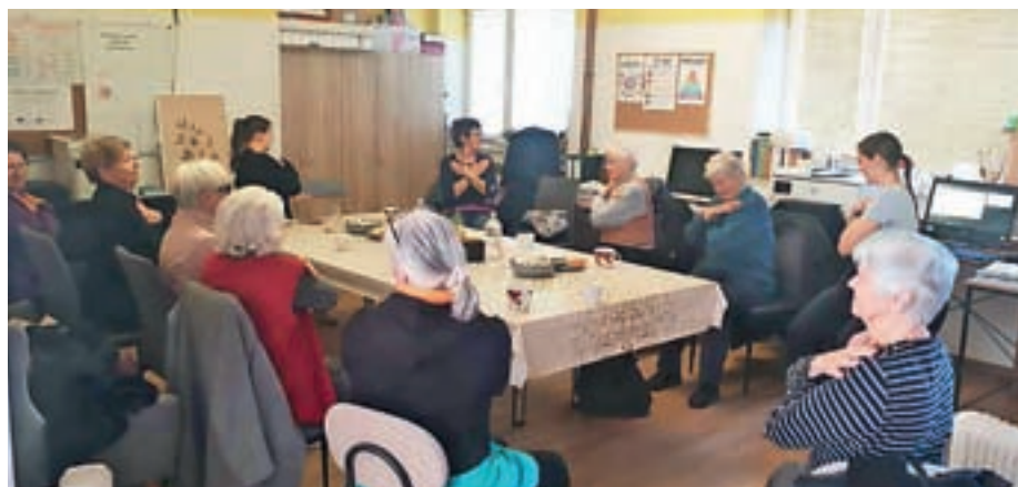
V Zavodu Generacije dvakrat mesečno organizirajo srečanja, na katerih obravnavajo teme, ki so pomembne in koristne za starejše.