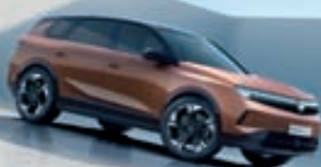
GRANDLAND ŽE OD 26.890 €*