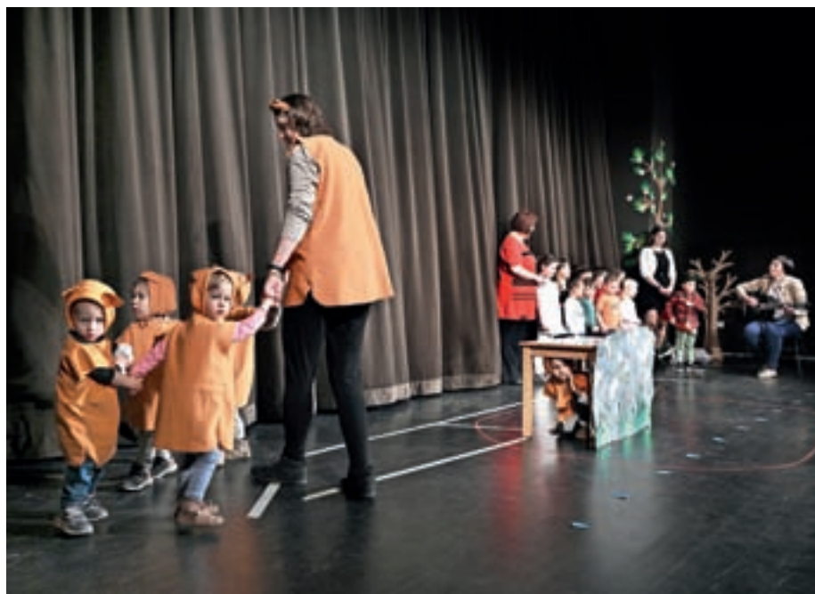
Otroci so navdušili z nastopi na praznovanju materinskega dne.

S pepelnično sredo se je začel postni čas, ki so ga v vrtcu spoznavali skozi postaje križevega pota, ki so jih spoznali tudi v animiranem risanem filmu.