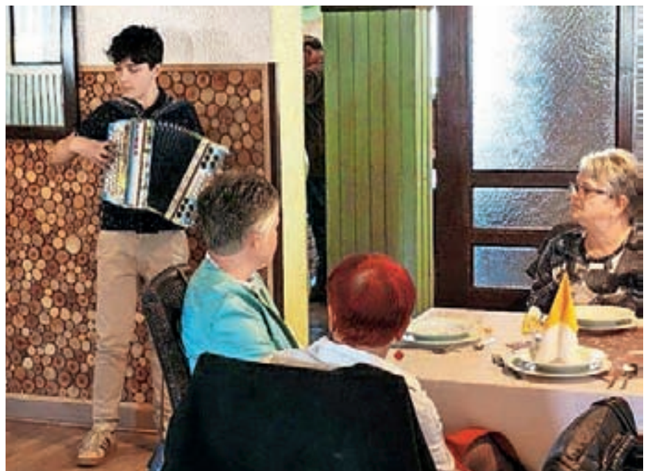
Srečanje je popestril mladi harmonikar.

Udeleženke srečanja so v znak spoštovanja, pozornosti in hvaležnosti prejele rdeč nagelj.